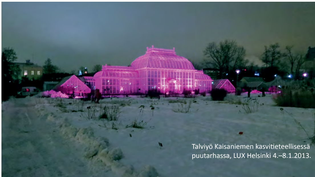
Talviyö Kaisaniemen kasvitieteellisessä puutarhassa, LUX Helsinki 4.–8.1.2013.