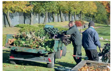
Pertti Uotila 2016