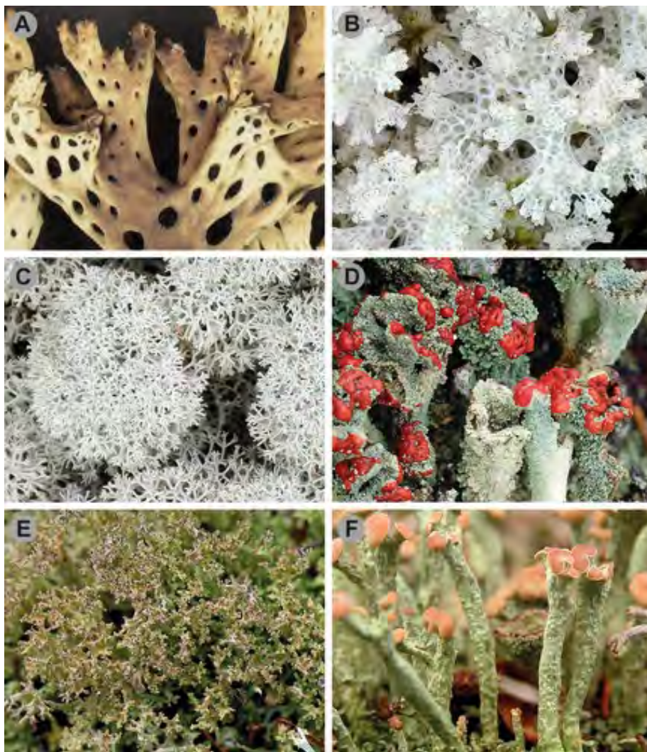
Fig. 4. Diversity of Cladoniaceae, illustrated by species of selected genera and Clades. A, Rexia sullivanii ; B, Pulchrocladia retipora ; C, Cladonia stellaris from Clade Impexae ; D, Cladonia pleurota from Clade Erythrocarpae ; E, Cladonia crispata var. crispata from Clade Perviae ; F, Cladonia botrytes from Clade Ochroleucae .

Jäkäläheimo Cladoniaceae (mm. torvijäkälät) on laajalle levinnyt, vaikka monet heimon pienemmät suvut ovat keskittyneet eteläiselle pallonpuoliskolle. Lajien ja sukujen rajaaminen on perustunut morfologisiin ja sekundaarikemiallisiin ominaisuuksiin, mutta koska nämä ominaisuudet vaihtelevat usein merkittävästi jopa lajitasolla, on luokittelu ollut vaikeaa. Nyt julkaistussa tutkimuksessa analysoitiin 643 näytettä eri puolilta maailmaa. Nämä edustivat kaikkiaan 304 lajia. Heimo Cladoniaceae sekä suku Cladonia osoittautuivat monofyleettisiksi. Suku Cladia jakautui useaksi ryhmäksi siten, että oli tarpeellista kuvata kaksi uutta sukua. Tutkimuksessa tuotettiin yhteensä 2 118 uutta DNA-sekvenssiä. — Soili Stenroos