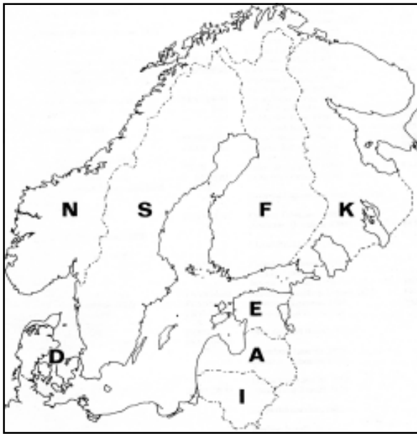
Kuva 1. Luettelossa käytetyt maakohtaiset lyhenteet. Bild 1. De landsvisa förkortningarna som används i katalogen. Figure 1. Abbreviations of the countries as used in the catalogue.

The previous list was arranged systematically using the system gradually created by R. Crowson in numerous works. A number of changes were introduced by Lawrence & Newton (1995), and this revised system has already been used widely. It is generally accepted here, too. In some cases the intrafamilial classification is based on still more recent works, so for instance in Adephaga the new Palaearctic catalogue (Löbl & Smetana 2003), in Staphylinidae the catalogue of Herman (2001), in Erotylidae the revision by Węgrzynowicz (2002) and in Curculionidae to a large extent the catalogue of Alonso-Zarazaga & Lyal (1999).