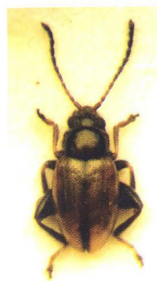
Kuva 3. Poikkeuksellisen tumma yksilö lajista L. lewisii .

Fig. 2. Males of Longitarsus lewisii (left), L. reichei (middle) and L. pratensis (right).