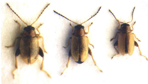
Kuva 2. Koiraat vasemmalta oikealle: Longitarsus lewisii , L. reichei ja L. pratensis .

Fig. 2. Males of Longitarsus lewisii (left), L. reichei (middle) and L. pratensis (right).